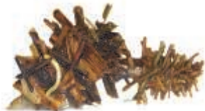
Bau einer Köcherfliegenlarve