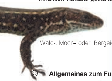
Wald-, Moor- oder Bergeidechse