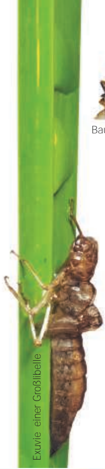
Exuvie einer Großlibelle