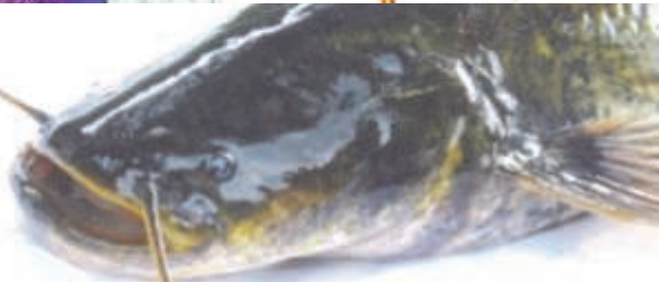
Wels, Ausstellungsobjekt 1,73 m